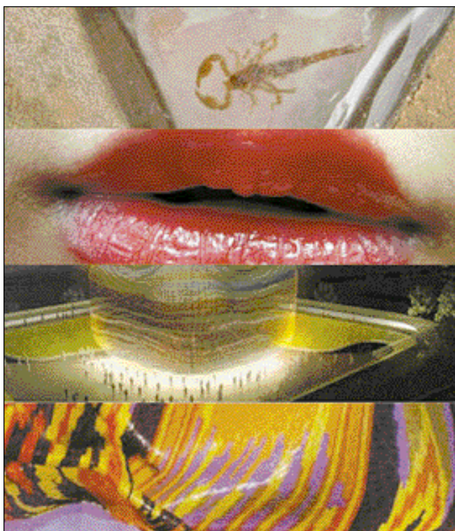
«Scrapbook 2010» di design*tools, progetto pilota per multiclient forecasting. Il progetto «Fuorisalone.it» di Studiolo