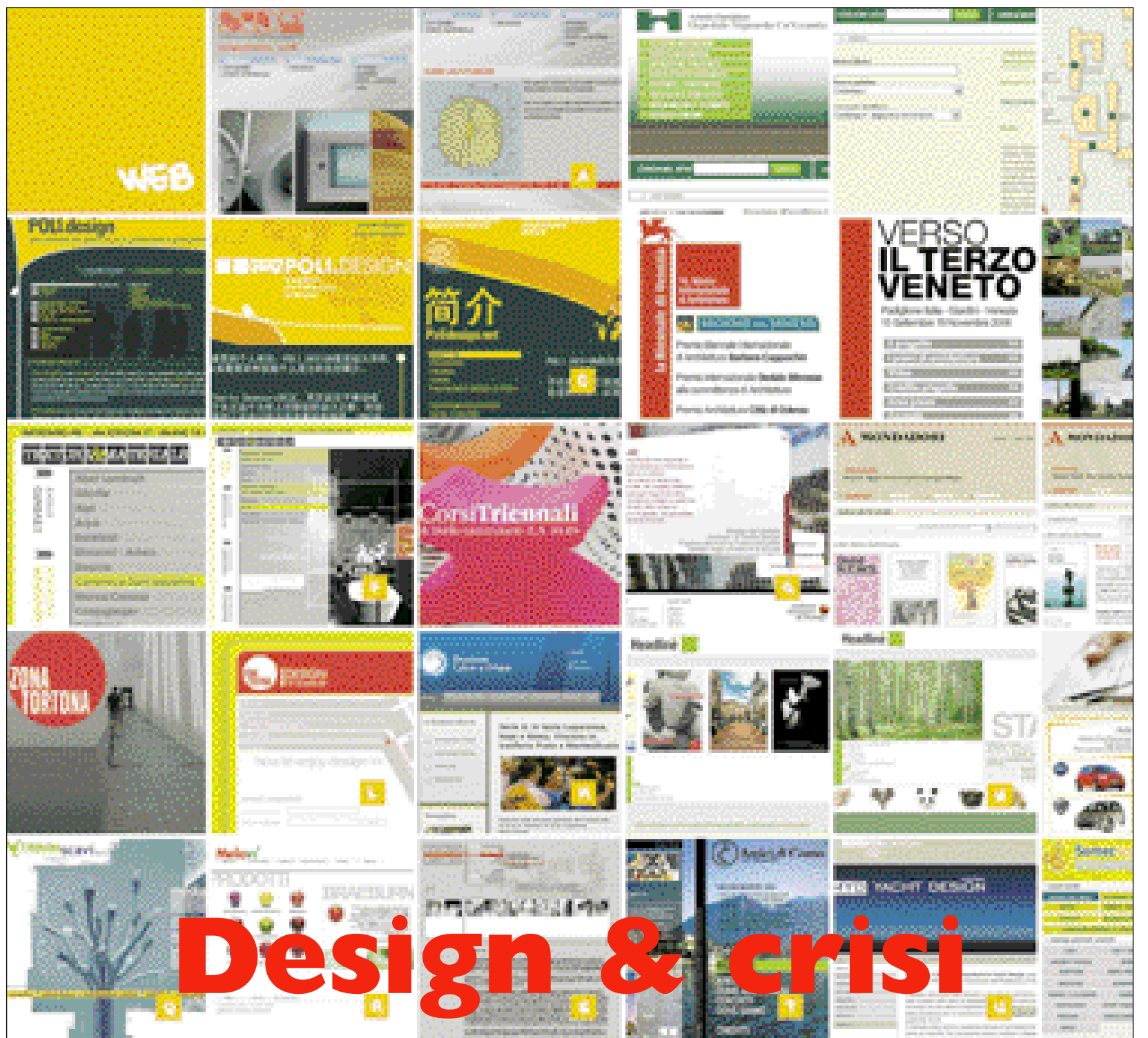
Alcuni progetti dell'area web di «Studiolabo», un esempio di collaborazione professionale tra designer

La crisi è il tema che in questo periodo invade e preoccupa il nostro quotidiano. È crisi per le grandi banche internazionali, crisi delle industrie, delle produzioni, dei consumi. Si cercano soluzioni per progettare una ricrescita e alternative negli investimenti. Per sfuggire alla crisi è fondamentale intuire la nuova visione del mondo che si sta generando. Ed è una visione che avrà una genesi sostanzialmente basata sulla critica del peggio di □ Intervista di Donatella Ferrari CONTINUA A PAG. 27