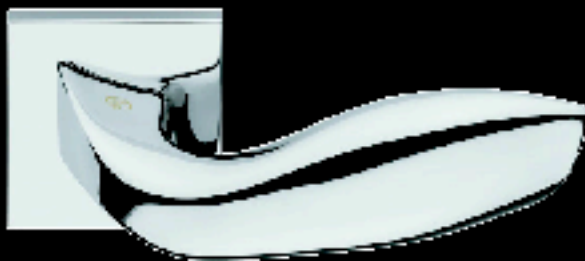
Serie FOG Duemilaquattro H 354 | Design Frank O. Gehry

Per la più attuale versione Frank O. Gehry, che vede la natura come fonte di suggestione da fondere nei suoi progetti in un continuo movimento espressivo, sceglie il contrasto.