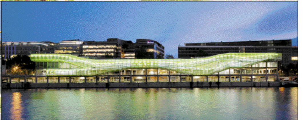
In alto a sinistra, l'Accademia di Belle Arti di Bologna, sede del nuovo design center; a destra, l'inaugurazione dell'anno del design a Torino; al centro e sopra a sinistra, il progetto di Isolarchitetti per il design center di Torino; sopra a destra, l'Institut Français de la Mode di Parigi