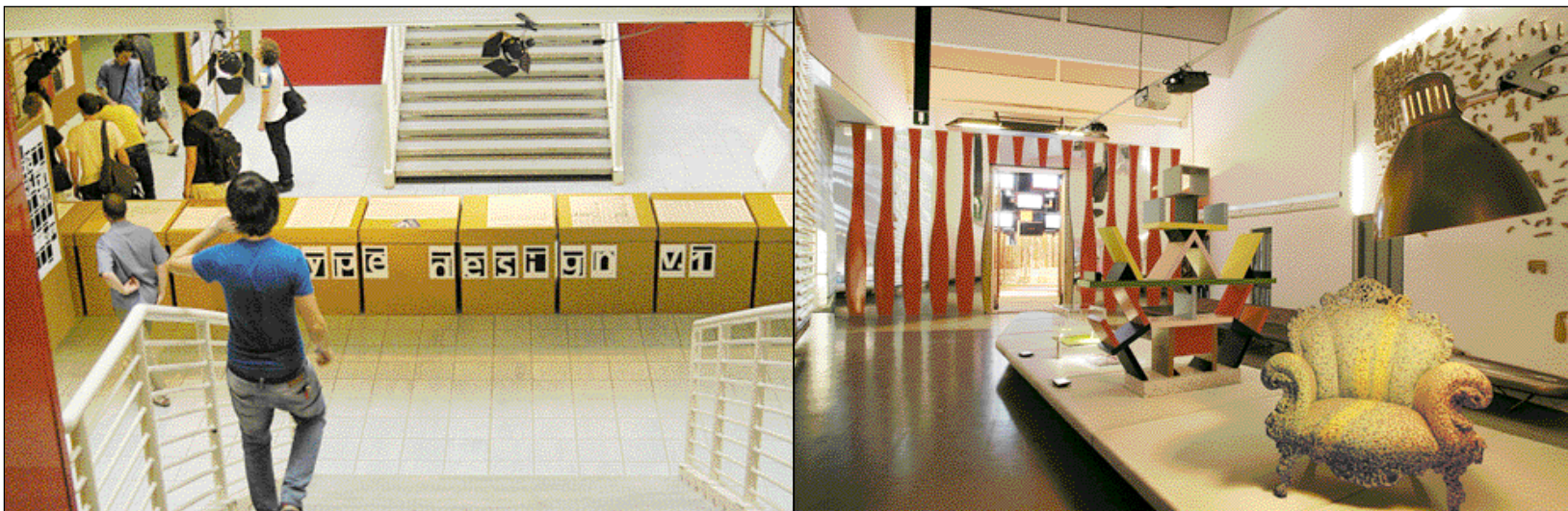
Una mostra dei risultati dei corsi di Type design della Facoltà di Design di Milano e del consorzio poli.design. Il Triennale Design Museum, un design center della messa in scena

tuto Europeo di Design attivo oggi in molte sedi in Italia e nel mondo.